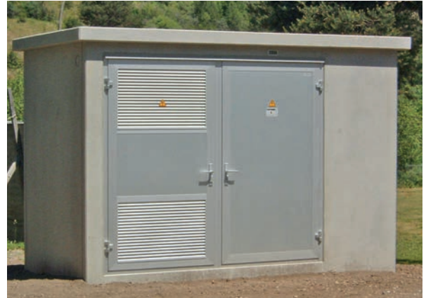
Türen MEGAPORT, Alu, farblos eloxiert 2 Türen nebeneinander platziert