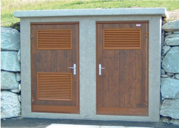
Türen MEGAPORT, Alu, farbig, lackiert mit Lüftungsgittern

Türen vom Typ MEGAPORT werden hauptsächlich in Trafostationen, Gasstationen, Wasserwerken und Betriebsräumen von öffentlichen Bauten verwendet. Das Einsatzspektrum deckt jedoch viele zusätzliche Gebiete ab.