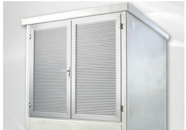
Doppelflügeltüre, Gehflügel links, Standflügel rechts, mit vollflächigen Lüftungsgittern